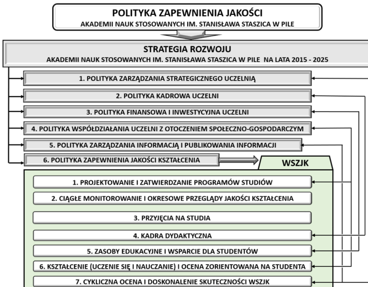
Rys. 1. Szczegółowe polityki zapewnienia jakości w uczelni